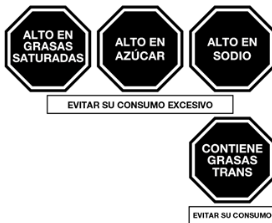
Gráfico 1: Advertencias publicitarias

El contenido de las advertencias publicitarias es el señalado en el Gráfico 1: